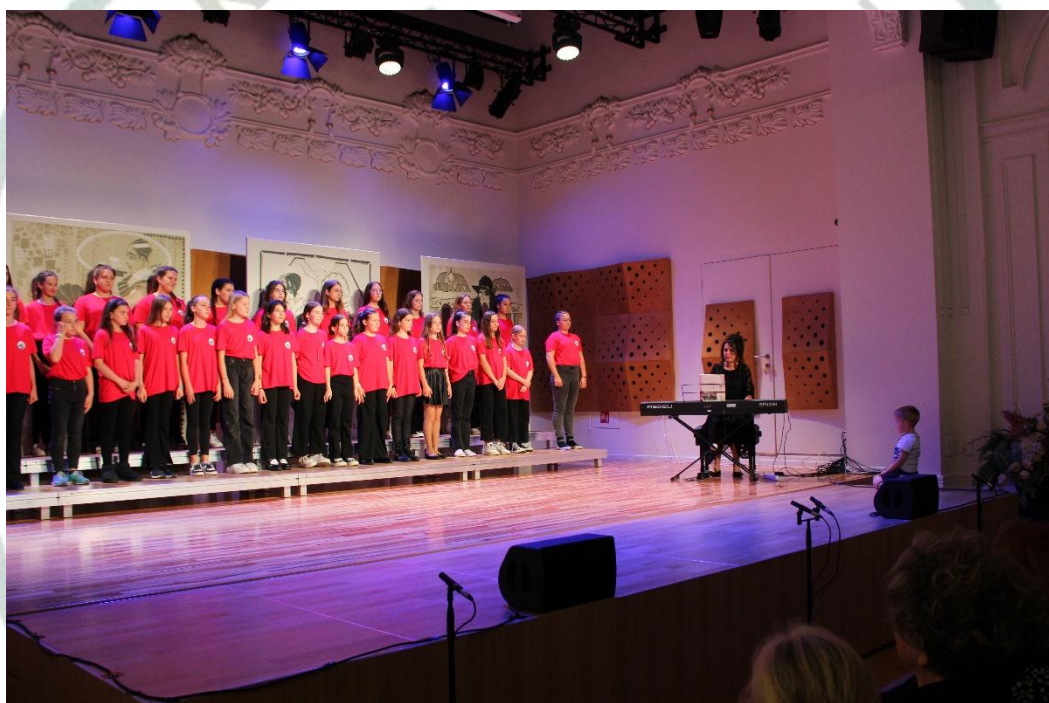
Školski veliki zbor - svečana priredba povodom obilježavanja 40-te godišnjice osnutka Škole, Hrvatski dom