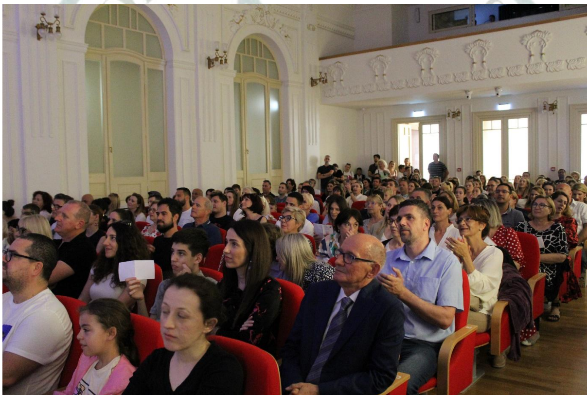
Hrvatski dom, svečana priredba obilježavanja 40-te godišnjice Škole