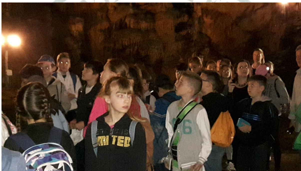
Izvanučionička nastava - Vranjača