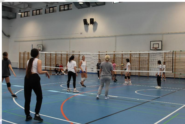
Odbojkaška utakmica - majke i učenice

Napomena: Obuka plivanja i vožnja biciklom održat će se ukoliko epidemiološke mjere dozvole održavanje navedenih aktivnosti.