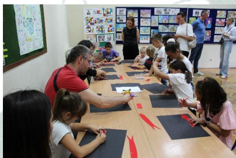
Dan otvorenih vrata

Ovaj oblik rada u školi u nije organiziran.