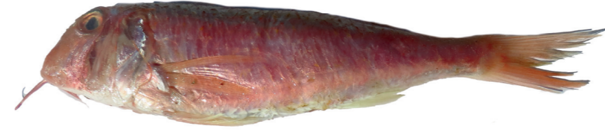
Trlja ( Mullus spp. )