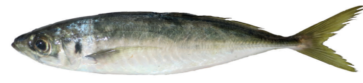
Šarun ( Trachurus spp. )