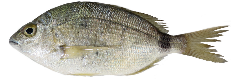
Špar ( Diplodus annularis )