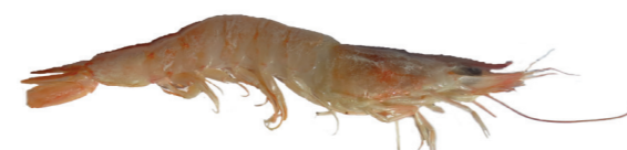
Kozica ( Parapenaeus longirostris )