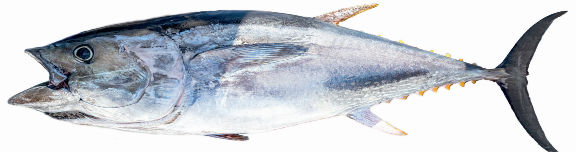
Tuna ( Thunnus thynnus )