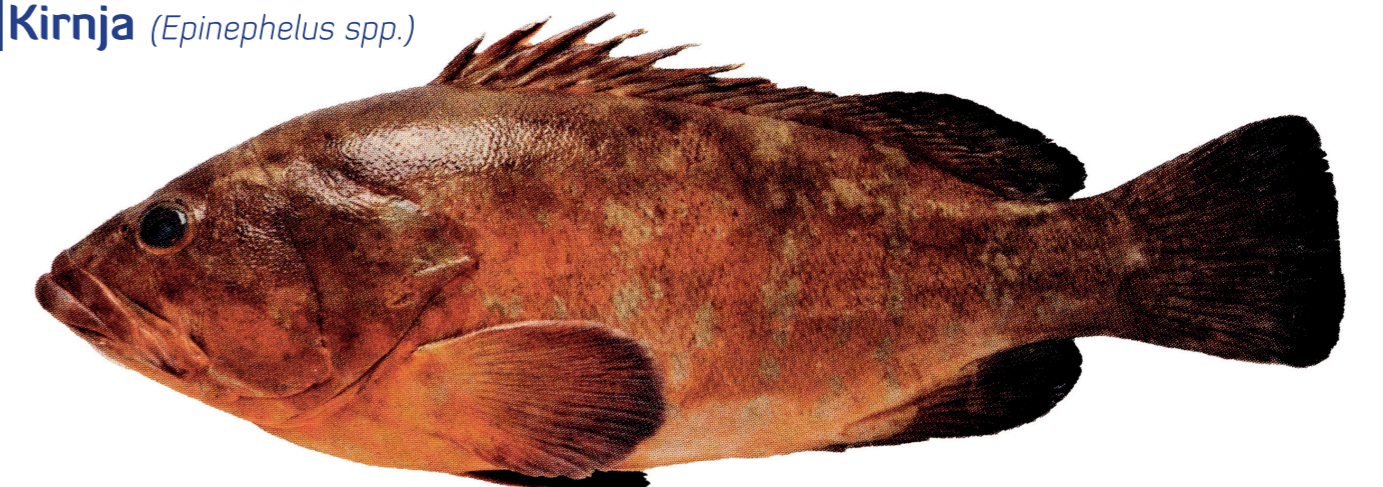
Kirnja ( Epinephelus spp. )