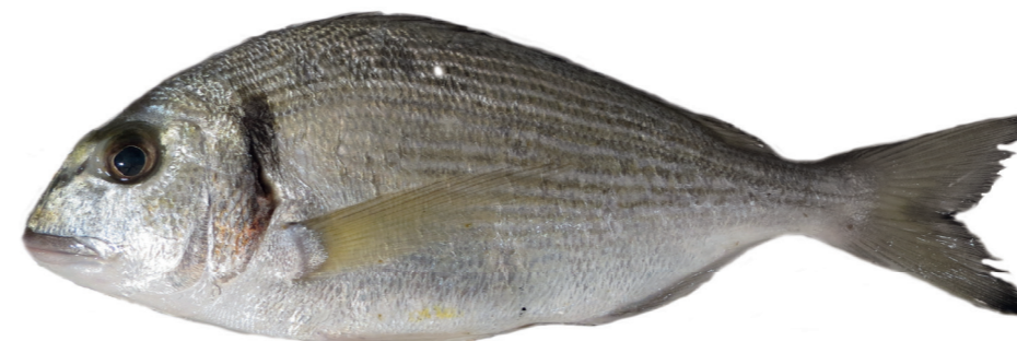
Komarča ( Sparus aurata )