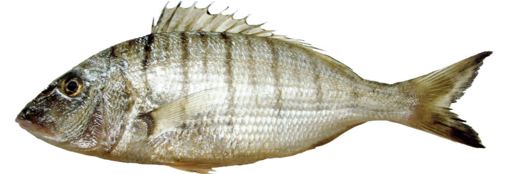
Ovčica ( Lithognathus mormyrus )