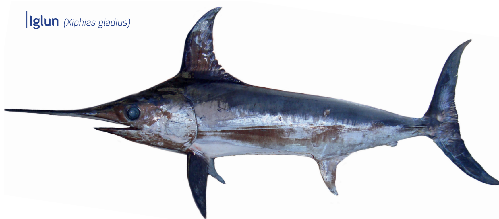
Iglun ( Xiphias gladius )