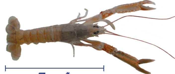
Škamp ( Nephrops norvegicus )