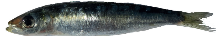
Srdela ( Sardina pilchardus )