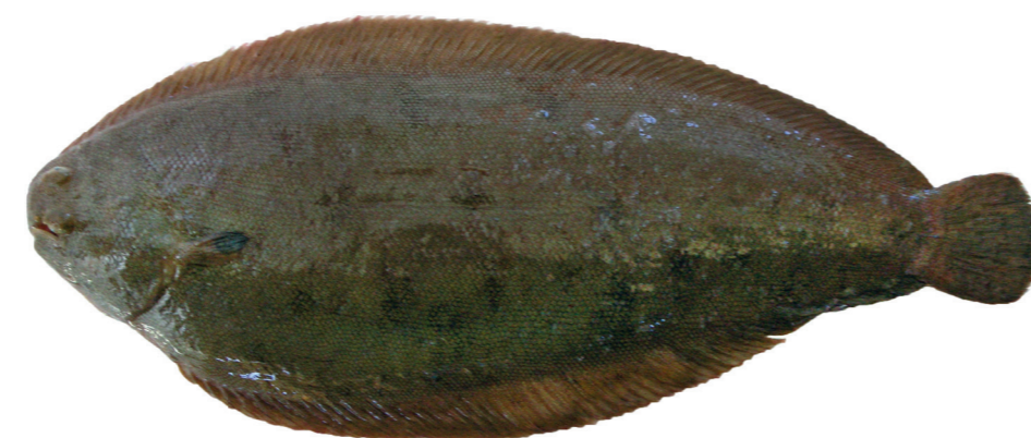
List obični ( Solea solea )