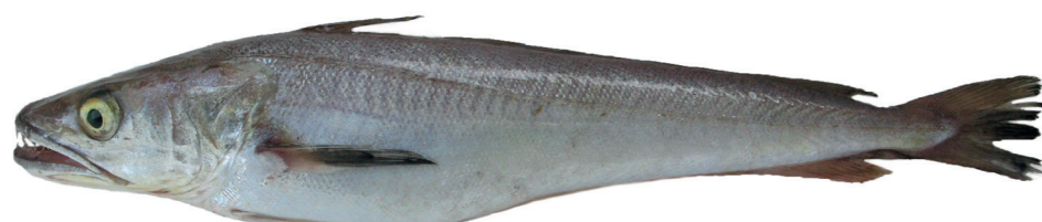
Oslić ( Merluccius merluccius )