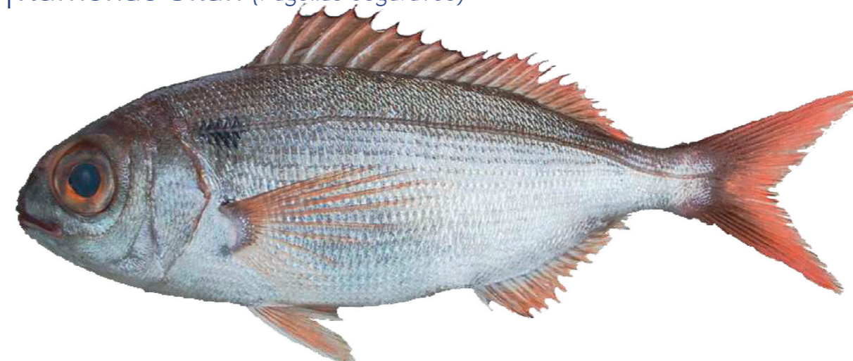
Rumenac okan ( Pagellus bogaraveo )