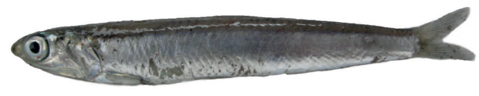
Inćun ( Engraulis encrasicolus )