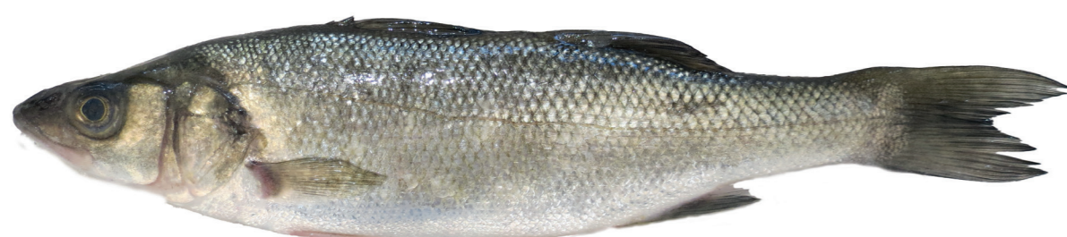
Lubin ( Dicentrarchus labrax )