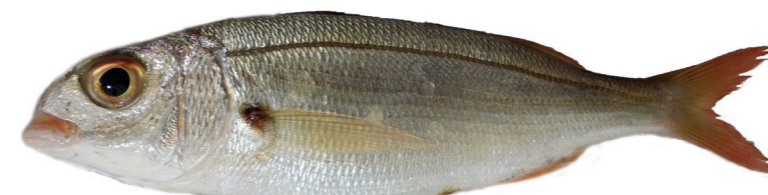
Batoglavac ( Pagellus acarne )