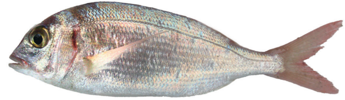
Arbun ( Pagellus erythrinus )