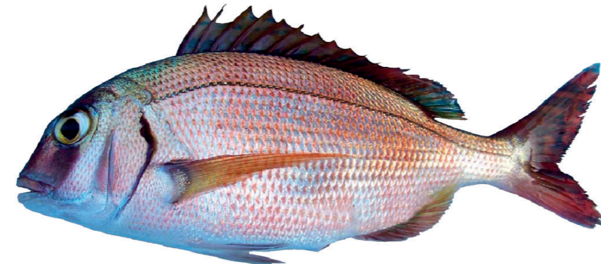
Pagar ( Pagrus pagrus )