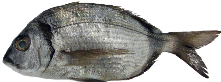
Fratar ( Diplodus vulgaris )