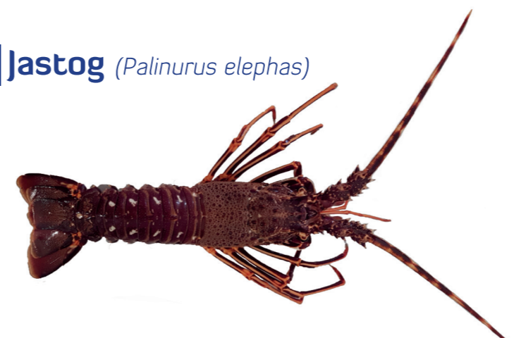
Jastog ( Palinurus elephas )