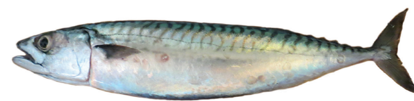
Skuša ( Scomber spp. )