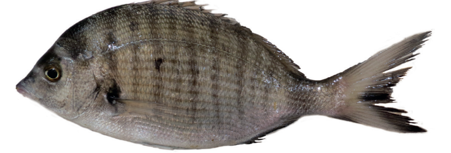
Pic ( Diplodus puntazzo )