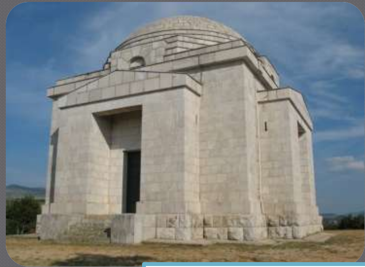
Mauzolej kipara Ivana Meštrovića u Otavicama pokraj Drniša