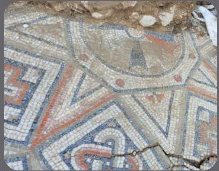
Mozaik iz ostataka crkvice izvan Palače