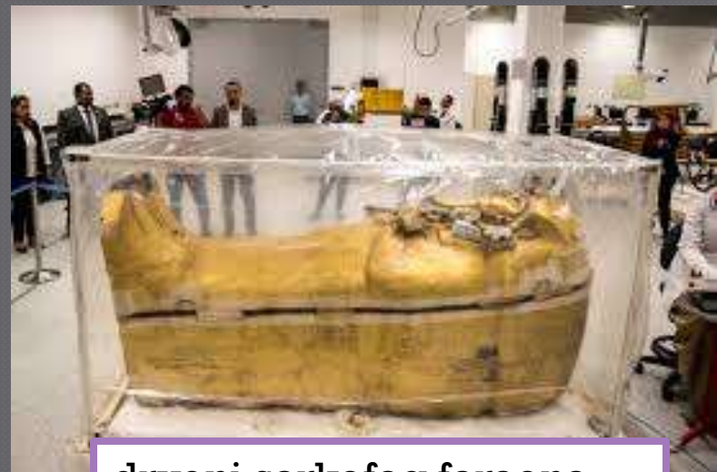
drveni sarkofag faraona Tutankamona/Egipat