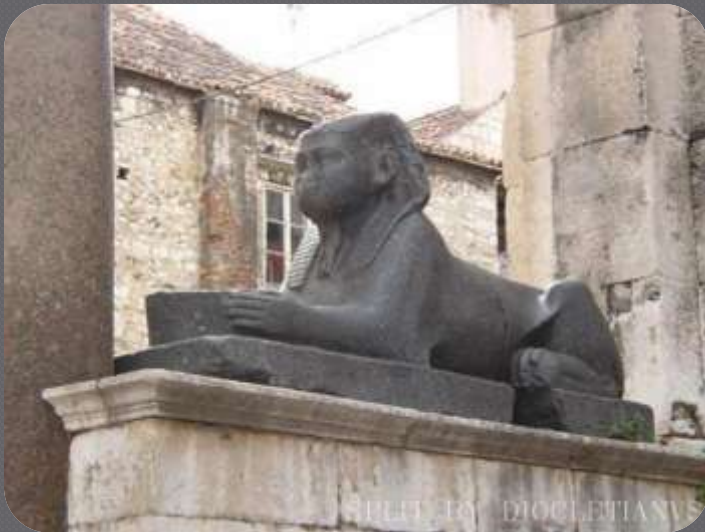
Sfinga na ulazu u Mauzolej/Katedralu