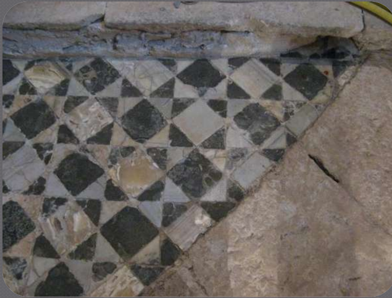
Mozaik u Katedrali ispod kamenog poda