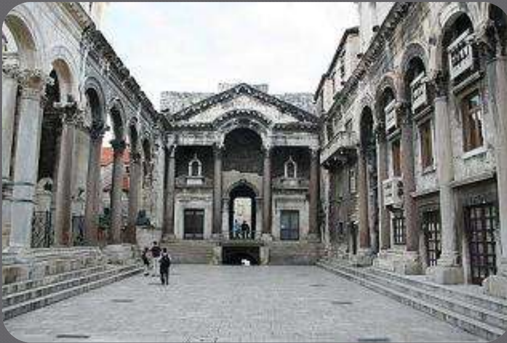
Peristil u Dioklecijanovoj palači