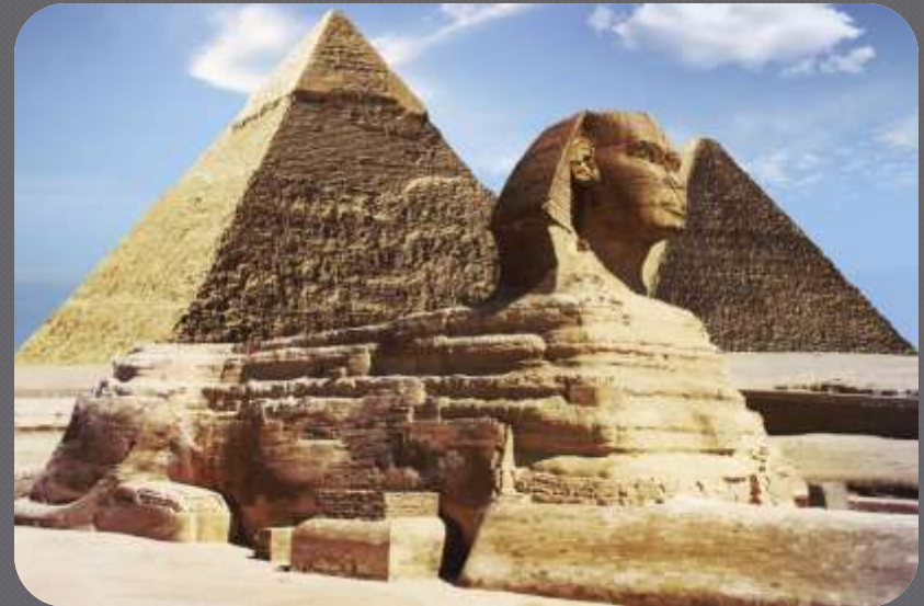
Velika sfinga u Egiptu ispred piramida