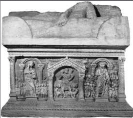
kameni sarkofag iz Solina, 4.st.