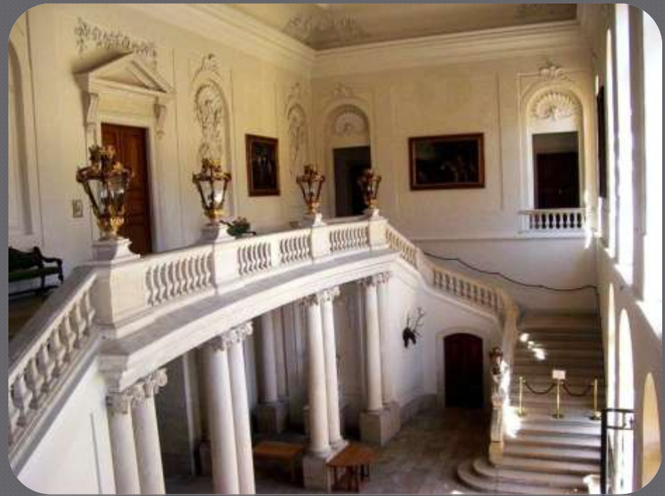
Dvorac u Austriji