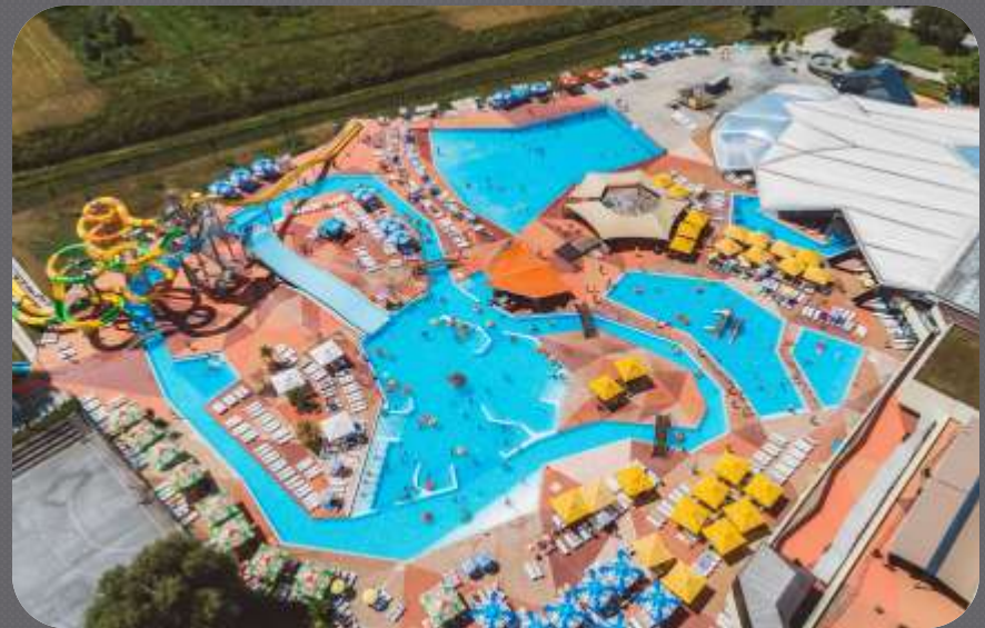
Terme Tuhelj sjeverno od Zagreba